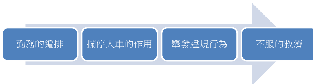
圖二 警察執行交通稽查的思考次序