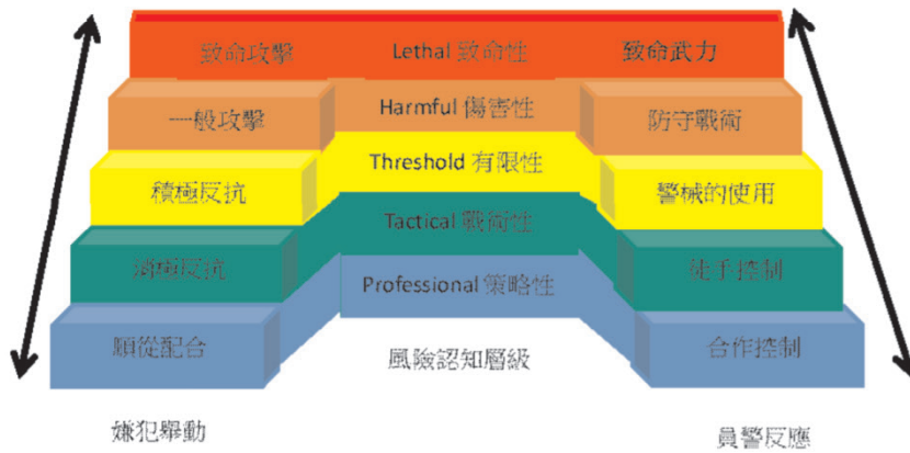
圖 1 強制力行使的連續性層級模型